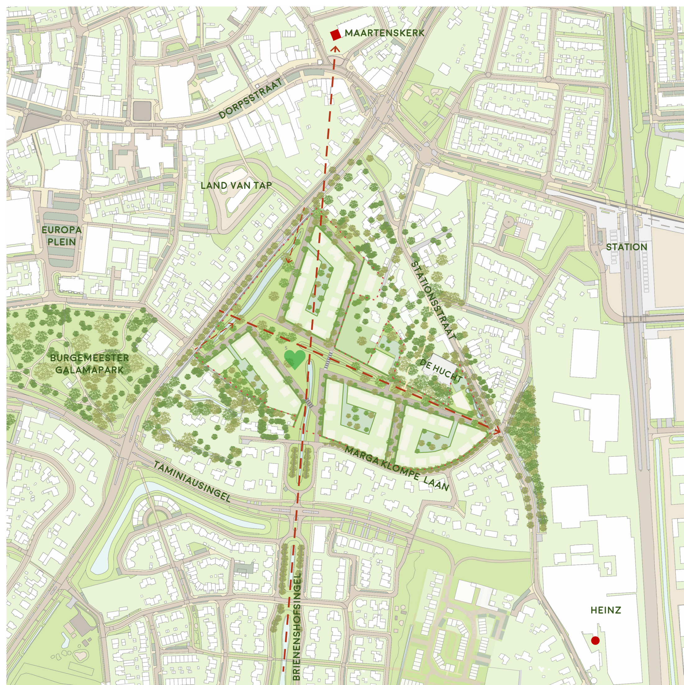
GROENI WATER. ZICHTLIJNEN