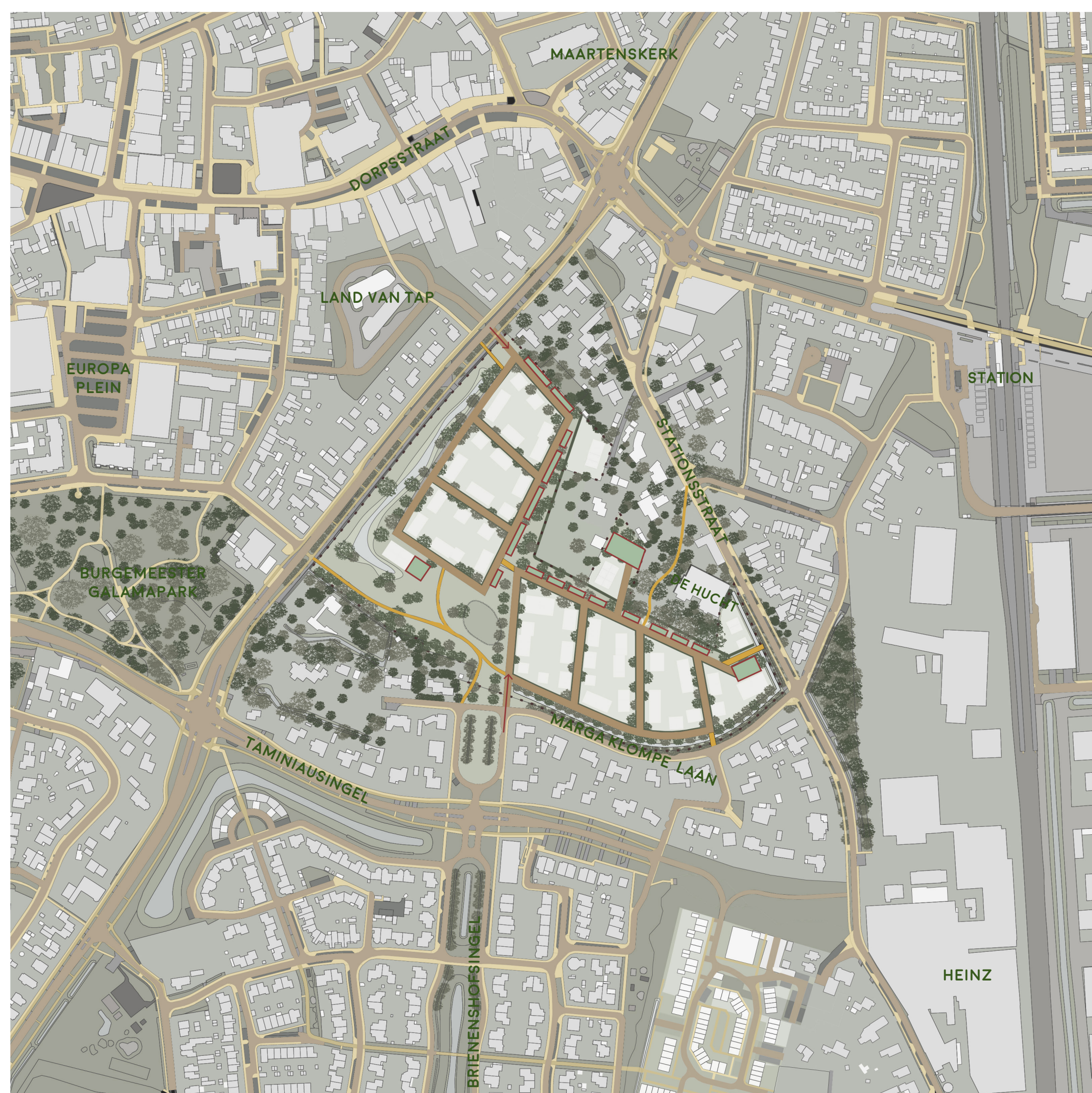
VERKEER • PARKEREN